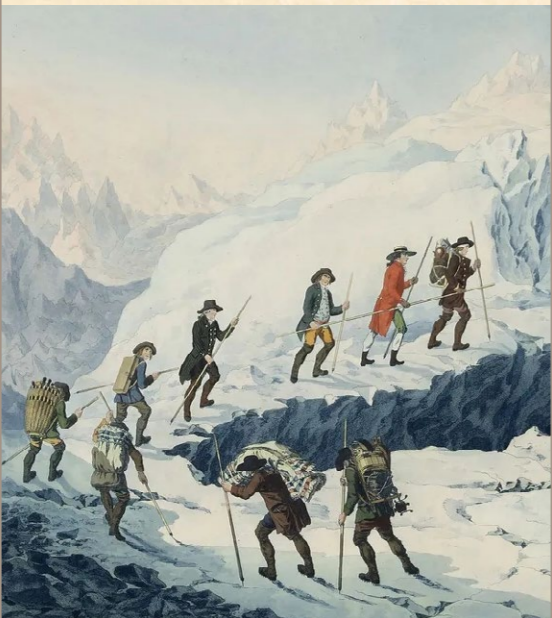
Bibliothèque de Genève (BGE)